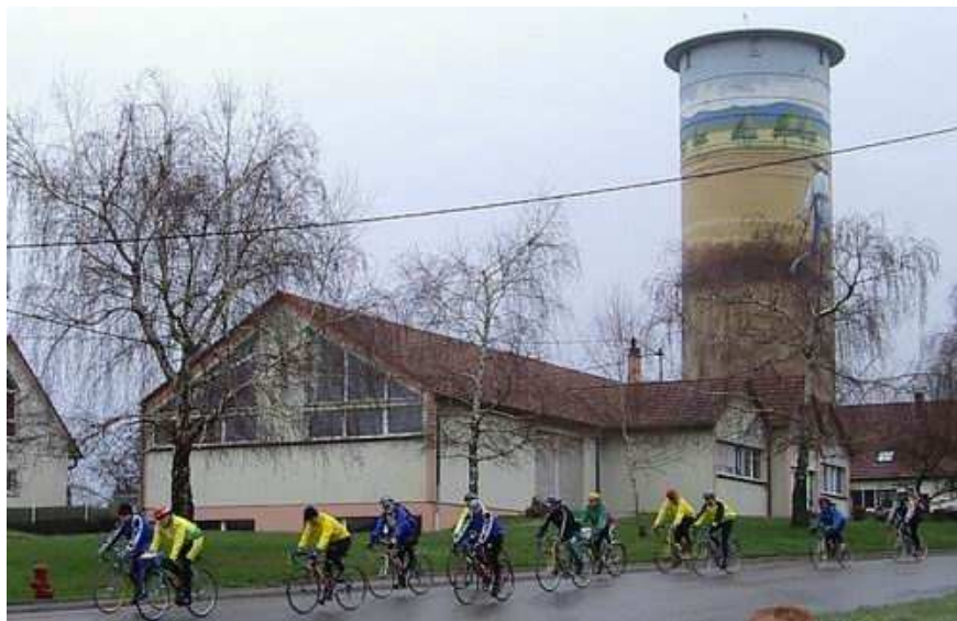
La pluie ne décourage pas ces cyclos.

Malgré un temps exécrable, les bourrasques activant une pluie glaciale, 203 courageux se sont donné rendez-vous dans la salle des fêtes de Schoenenbourg pour déposer leur don, prendre contact autour d'un café et remplir l'inévitable bulletin d'inscription, avant de se jeter à l'eau pour la bonne cause.