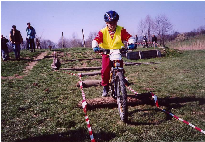
Rondins et fossé...