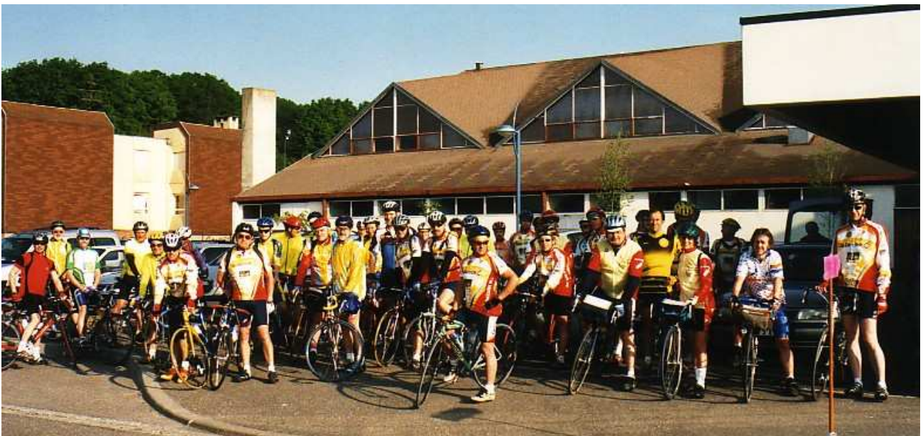
Les participants au départ.

A 8 heures, après la photo souvenir, le groupe quitte Ingwiller pour Wimmenau et voici déjà la grimpée vers la colonne des douze apôtres, suivie de la descente sur Soucht par Meisenthal et de nouveau on grimpe pour Montbronn où les membres du Cyclo Club d'Ingwiller nous ont réservé un contrôle surprise avec ravitaillement, très apprécié par les participants.