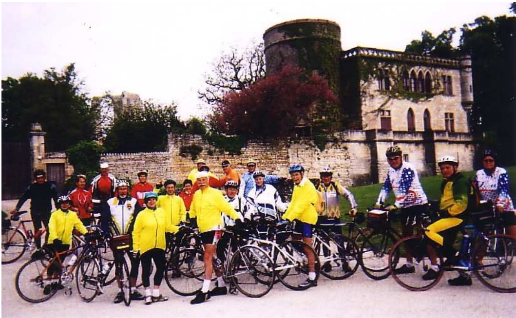
Une partie des participants à la semaine cyclo du Marais Poitevin.

Le comité du club a organisé ce séjour de main de maître pour notre plaisir à tous et nous les en remercions vivement. Les circuits proposés variaient entre 40, 60 et 90 km environ par jour. Le temps, au beau fixe bien que frisquet le matin, nous a permis de sillonner cette région, plat pays il est vrai, mais tellement pittoresque, en longeant les nombreux canaux et rivières, guidés en cela par nos amis cyclos du club local. Notre lieu de séjour étant situé aux confins de trois départements, nous nous aventurons sur les routes des Deux-Sèvres, de la Charente-Maritime et de la Vendée.