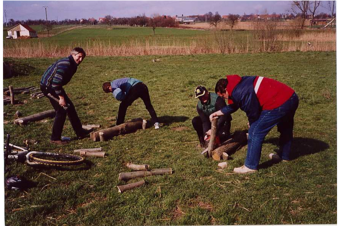
La construction d'un obstacle du parcours de maniabilité