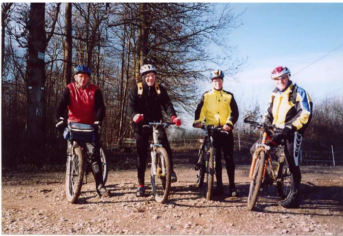
L'équipe technique lors de la reconnaissance des circuits.