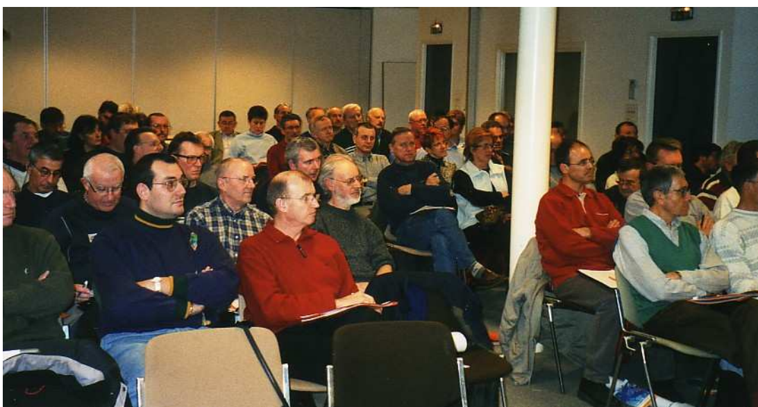
Une assistance très attentive.

5 clubs se sont investis dans cette journée (Epfing, Wisches, Mundolsheim, Ingwiller et Schoenenbourg), ce qui a permis de récolter la coquette somme de 7 200 €. Grâce à ces dons, il a été possible de venir en aide à 6 personnes handicapées dans le besoin, en majorité des jeunes, pour l'acquisition de matériel ou aide technique.