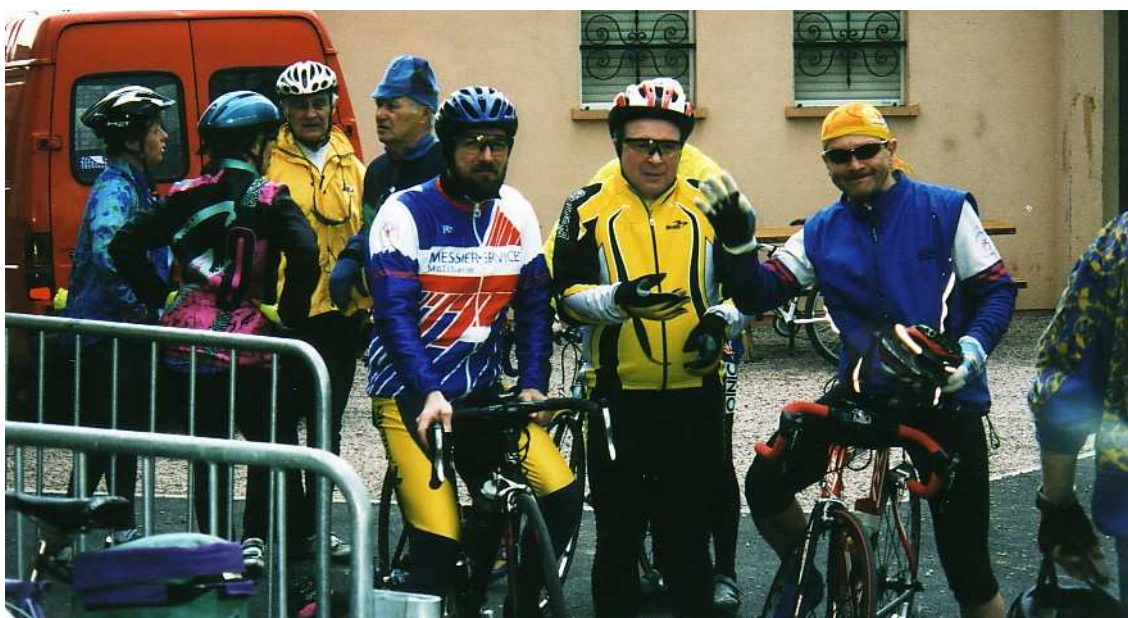
Des cyclos prêts à affronter le mauvais temps pour la bonne cause.

Les cyclos, les vététistes et les marcheurs sont venus rejoindre les membres du Cyclo Club Epfig pour soutenir l'action en faveur des personnes handicapées. Malgré une météo défavorable, 130 cyclos et 107 vététistes ont bravé la pluie et le vent sur les différents circuits proposés. Les 185 marcheurs, moins découragés par le vent, ont parcouru les 10 km. Au retour, dans la salle de la maison Cottolengo la petite restauration proposée réunissait les participants dans une ambiance conviviale.